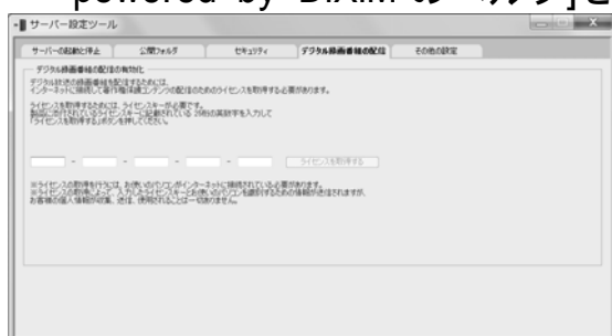
デジタル録画番組の配信機能のライセンスキー入力画面 (サーバー設定ツール) (モデルによっては画面が若干異なる場合があります。)

詳しくは、[スタート]-[すべてのプログラム]-[ホームネットワーク]にある[ホームネットワークサーバー powered by DiXiM のヘルプ]、ならびに[ホームネットワークプレーヤー powered by DiXiM のヘルプ]をご覧ください。