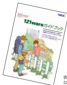
表紙の色、デザインは異なることがあります。

マニュアル/インターネット/電話/出張といった各種サポート・サービスからパソコン教室まで、お一人おひとりにあったNECあんしんサポート情報をこの冊子に満載しています。